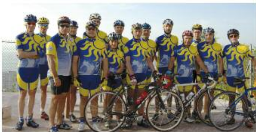
Le Club Cycliste de Beausoleil

"Un entraînement régulier. Si l'on saute un dimanche, on est à la peine la fois d'après. Si l'on peut rouler en semaine, au contraire, on est plus tonique."